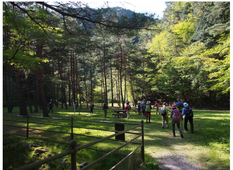
▲新緑の綺麗な登山道