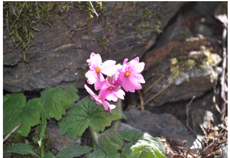
▲シコクカッコウソウ

緑焔く新緑の森の中、あちらこちらに春の花々が咲いていました。中でもヒカゲツツジは綺麗で花を楽しみながら銅山ヒュッテ、西山と歩きました♪